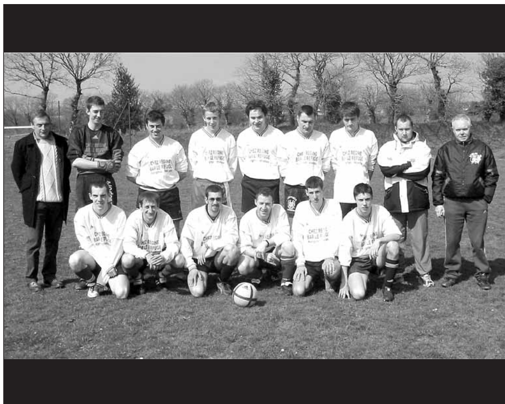
L'équipe A de l'Union Sportive Kergristoise au terme d'une saison pleine de réussite

D'ores et déjà un sentier est balisé au départ du bourg et sillonne le bois (balisage jaune). Une première boucle d'une quinzaine de kilomètres, puis une plus courte seront indiquées. Les descriptifs des circuits sont disponibles à l'office du Tourisme de Rostrenen ainsi qu'à la mairie et la superette de Kergrist-Moëlou.