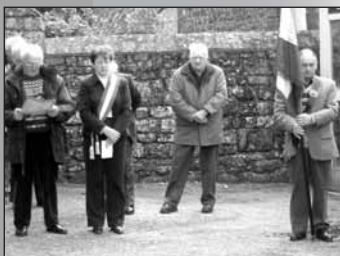
Le 8 mai, devant le Monument aux Morts