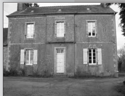
Le presbytère... dernière photo avant grands travaux !