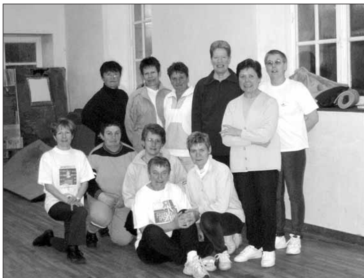
Gymnastes Kergristoises !

Une demande de subvention a été faite auprès du Pays pour l'aménagement scénique et acoustique.