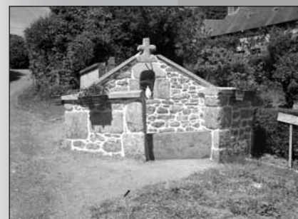
La fontaine du bourg, maintenant rénovée.