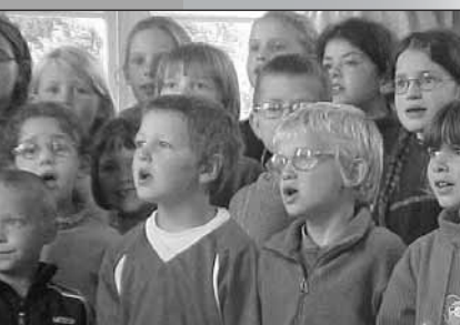
Promenade sur l'Île de Bréhat le 25 juin