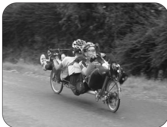
Dans quel sens vont-ils ?