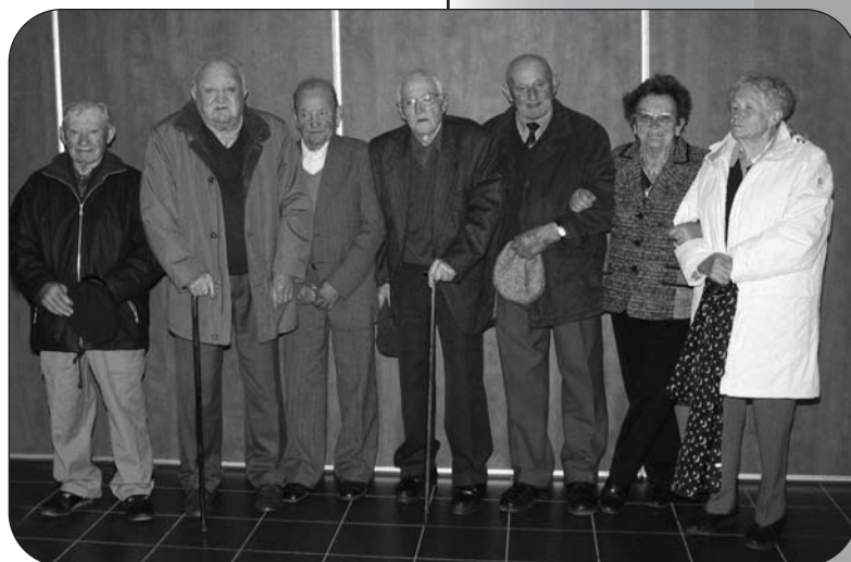
les doyens de l'assemblée au repas du 11 Novembre