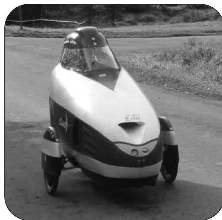
Drôle de vélo !