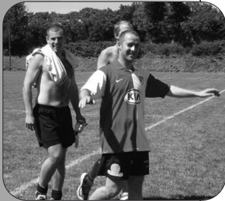
Chaud pour la fête de l'USK...