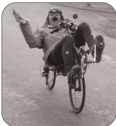
A manger, SVP !

Passage du Paris-Brest-Paris 2007 à St-Lubin