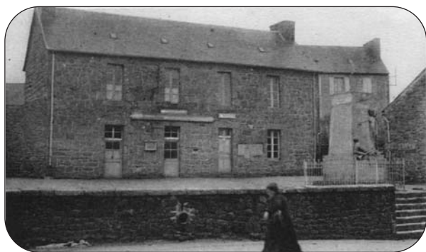
La Mairie, la Poste, le Monument aux Morts