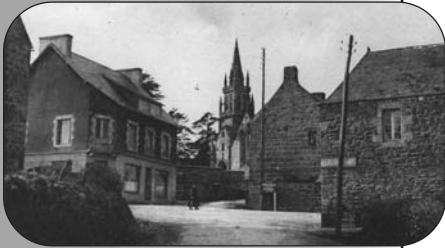
Entrée du bourg

Après en avoir délibéré, le conseil municipal