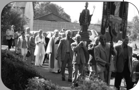
procession du pardon de st lubin