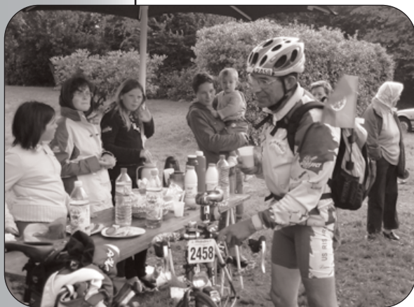
Ravitaillement à St-Lubin...